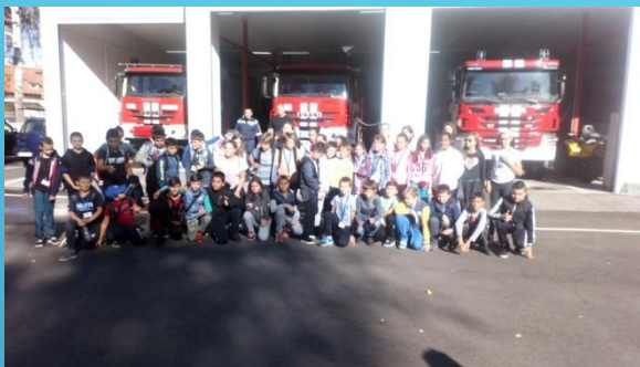
Запознаване с професия Пожарник