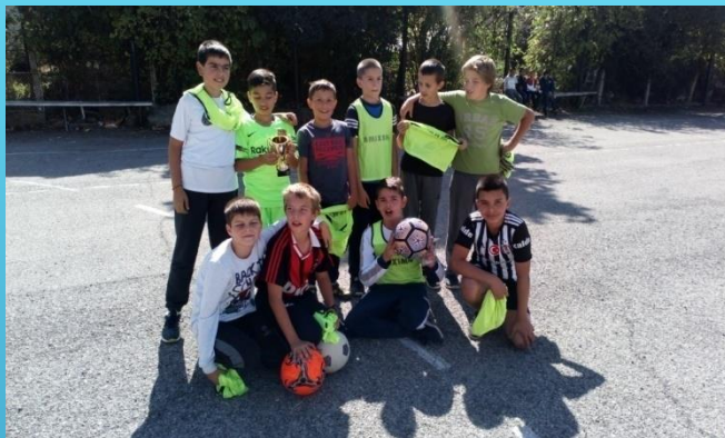
Участие в турнир по футбол