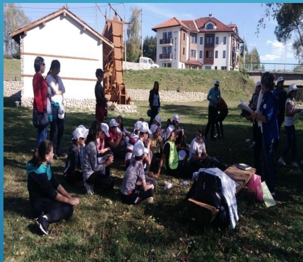
беседа във връзка с вредата от употребата на никотин, алкохол и упойващи вещества