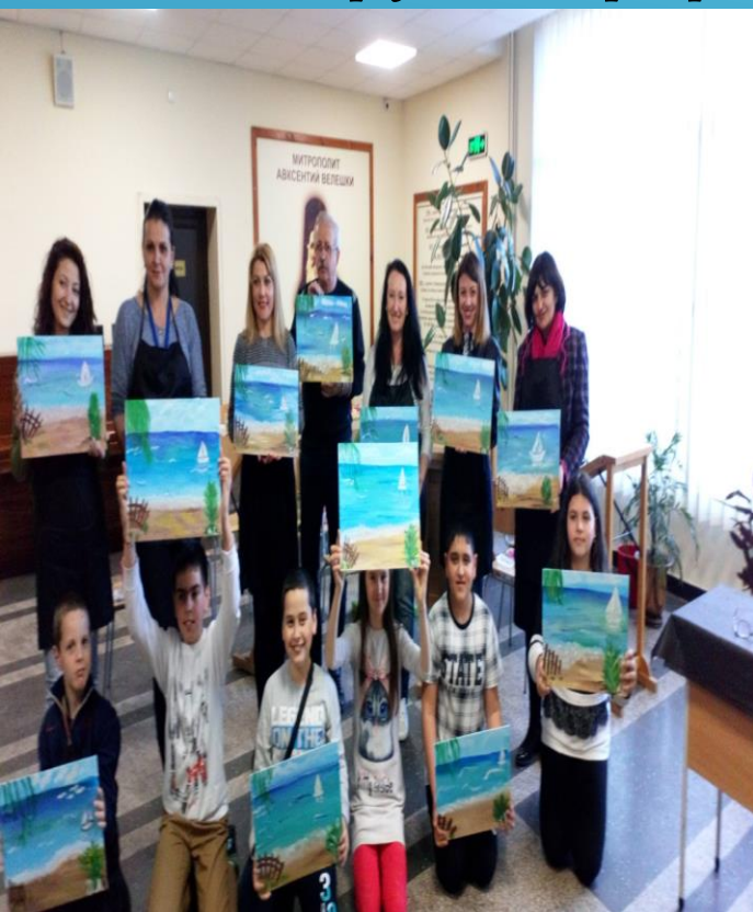
Учители и ученици в магията на изкуството