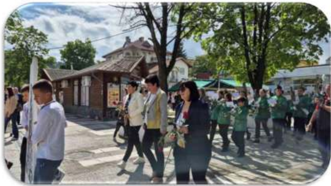
Празнично шествие и награждаване на учители и ученици