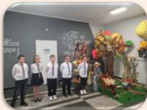
Мечо Пух на 97 години