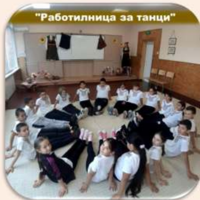
"Работилница за танци"