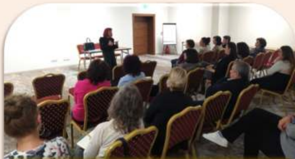
Обучение на учители