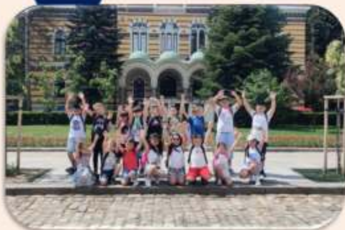
I клас – Музейко