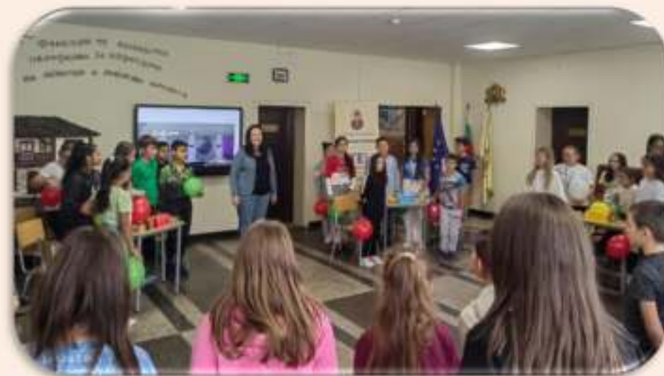
Интерактивен урок по Човекът и природата