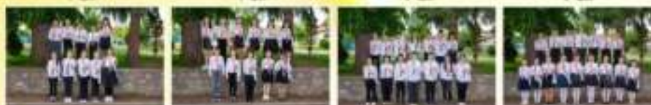
2 а клас