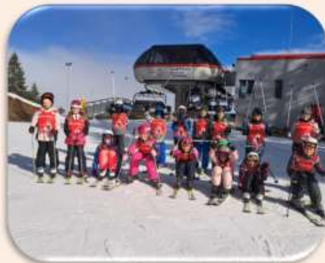
НП "Научи се да караш ски"