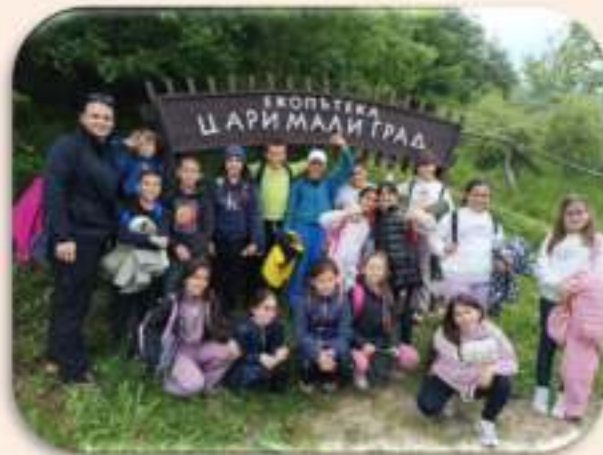
III клас – Цари мали град