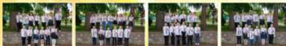
1 а клас